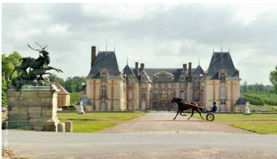
© LE TIOT - Jean-Luc Lemaire