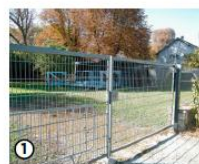
1. PORT À L'ANGLAIS VITRY-SUR-SEINE