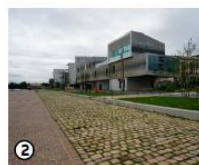
2. PORT DE CHOISY-LE-ROI / FERME DES GONDOLES QUAI FERNAND DUPUY