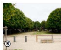
3. PLACE MOULIÉRAT VILLENEUVE-SAINT-GEORGES