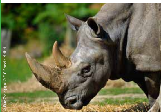
© Parc Zoologique © F-G Grandin MNHN