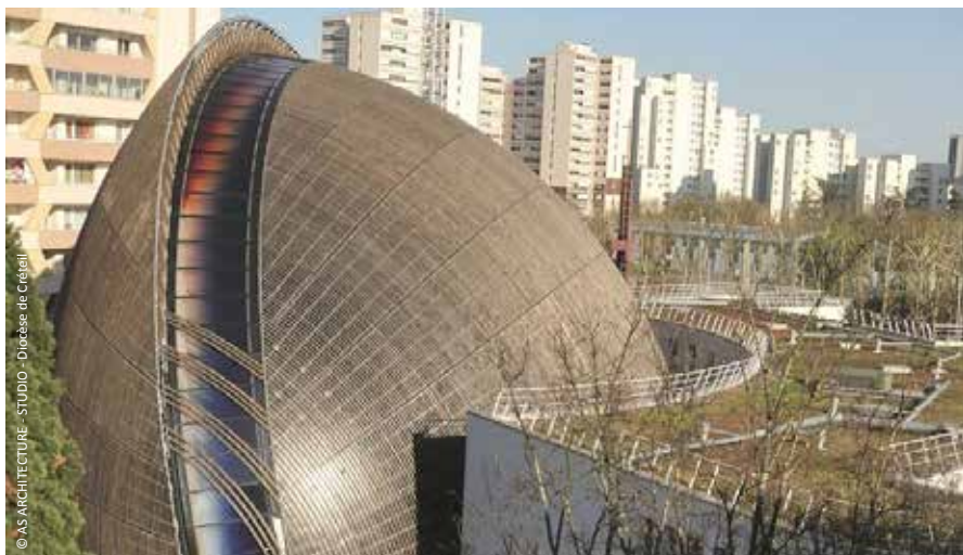
© AS ARCHITECTURE - STUDIO - Diocèse de Créteil